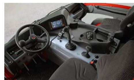
Das perfekte Cockpit