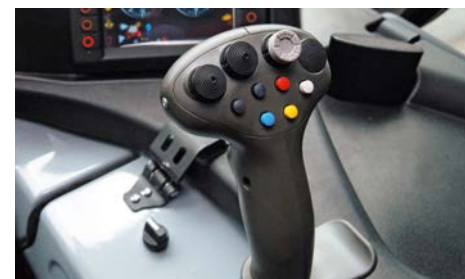
Multifunktionaler Fahrhebel mit Farbführung

Die Entwicklungsstufe Euro 6 bringt nochmals eine markante und eindrucksvolle Abgas- und Partikelreduktion.